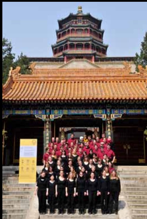
Vor dem Pavillon des Buddhistischen Wohlgeruchs 在佛香阁前