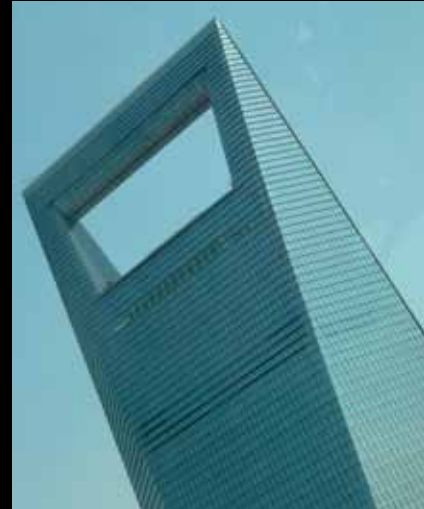
Außen / 外观