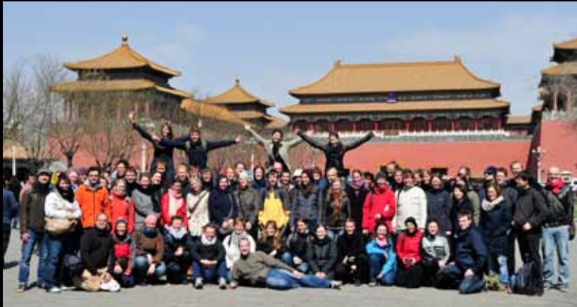
Vor dem Mittagstor in der Verbotenen Stadt 故宫午门前