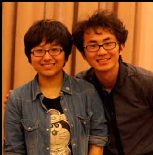
Partymoderatoren / 联欢会主持人