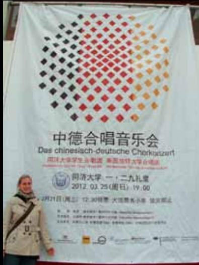
Werbeplakat für das Konzert am 26.03.2012 an der Tongji University 2012年3月26日在同济大学举行的音 乐会的巨幅海报