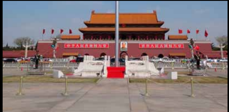
Platz des himmlischen Friedens 天安门广场