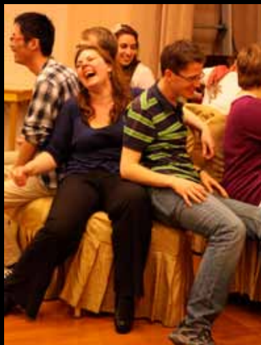
Beim Spielen viel zu lachen... 开心的游戏