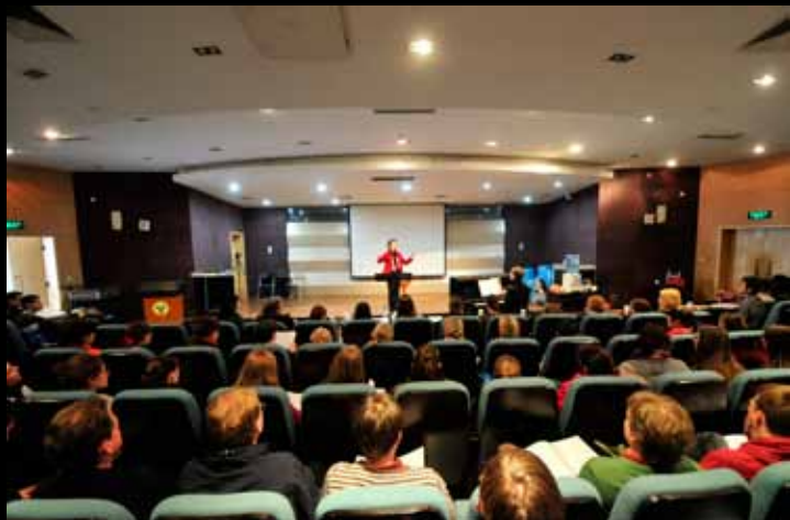
Workshop für Deutsche Gesangstechnik, Aussprache und Stimmbildung / 德语演唱技巧、发音和发声的练习