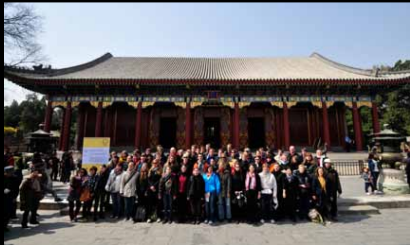
Vor der Halle des Wohlwollens und der Langlebigkeit 仁寿殿前