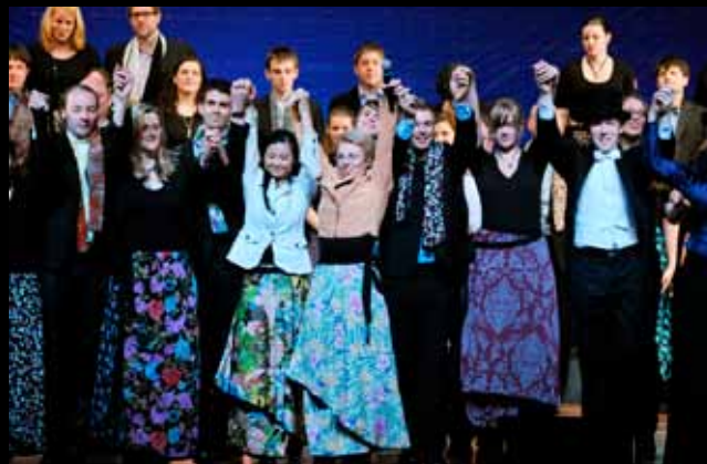
Applaus für den Unichor Stuttgart / 斯图加特大学合唱团谢幕