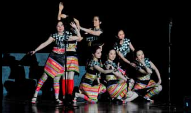
Tanzdarbietung des Frauenchors / 东南大学女生合唱团表演唱