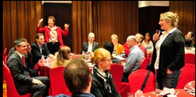
Abendessen mit Gesangseinlage / 晚餐上的助兴演唱