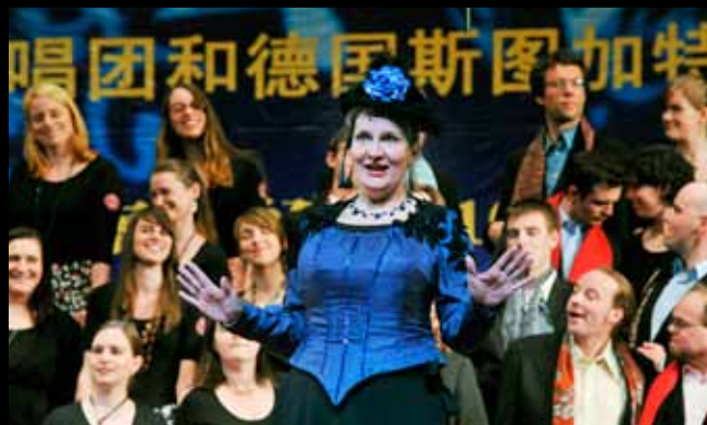
Szene aus Johann Strauß' „Die Fledermaus“ / 歌剧《蝙蝠》节选