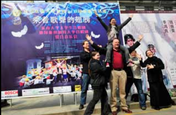
Werbeplakat für Konzerte in Nanjing 在东南大学举行的音乐会的海报