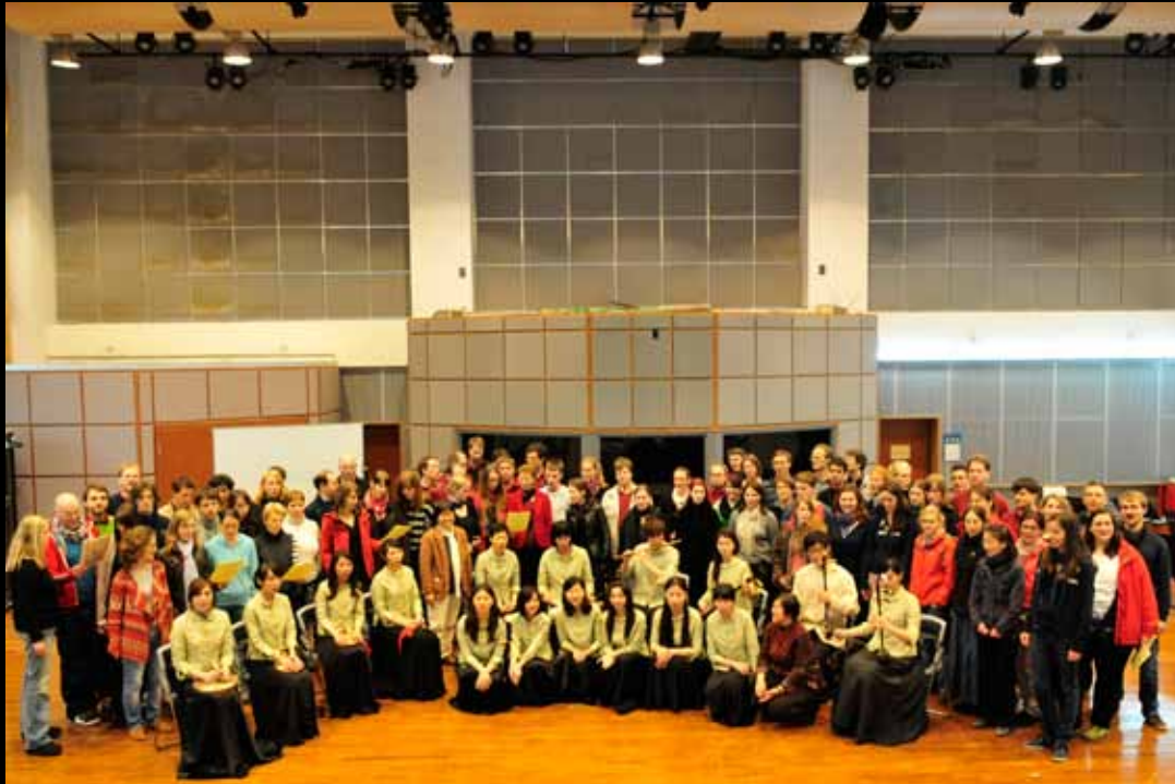
Einstudierung des „Jasmin“-Liedes anhand der Gongche-Notation 用工尺譜學唱《茉莉花》