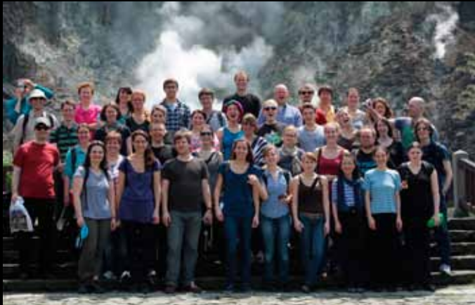
Vor dem schwefeldampfenden Xiaoyoukeng-Vulkan 在噴出硫磺氣的小油坑火山噴氣孔前