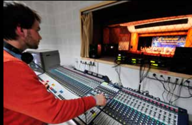
Große Herausforderung für den Bühnentechniker 舞台技术人员的巨大挑战