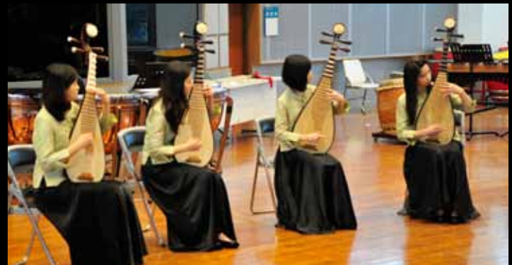
Pipa-Spielerinnen / 琵琶演奏