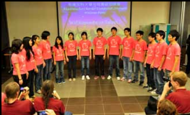
Delegation des NTU Chorus / 台大合唱團小團演唱