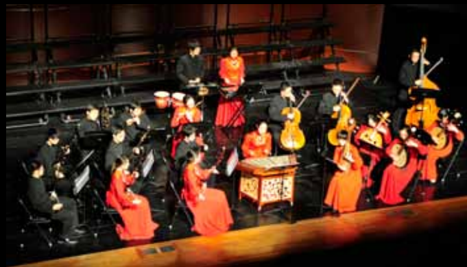
Das chinesische Orchester der Tsinghua University 清华大学民乐团