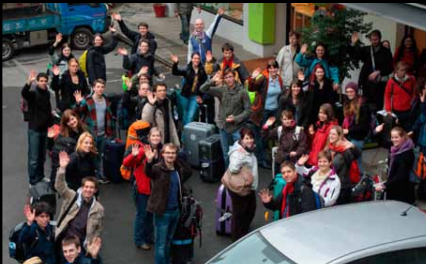
Ankunft im Lu-Ming Guest House der National Taiwan University (NTU), Taipeh/Taiwan 抵達國立臺灣大學鹿鳴雅舍