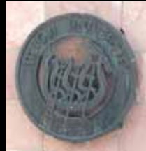
Logo der Tongji University 同济大学校徽