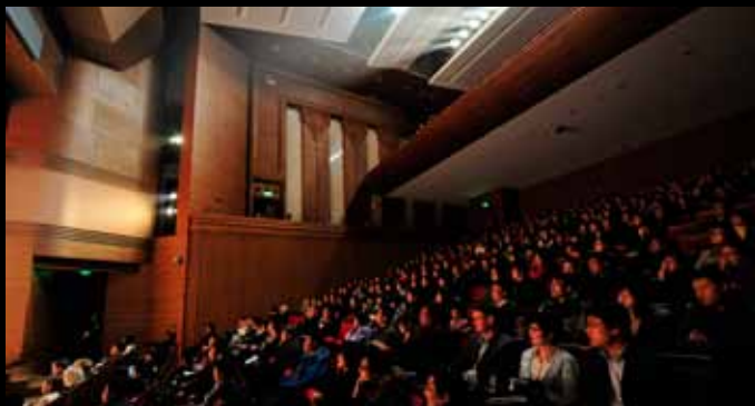
Mengminwei-Konzertsaal mit Holzgetäfelten Wänden und Decken 蒙明伟音乐厅内部