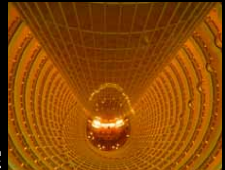
Jin Mao Tower Innen 金茂大厦内部