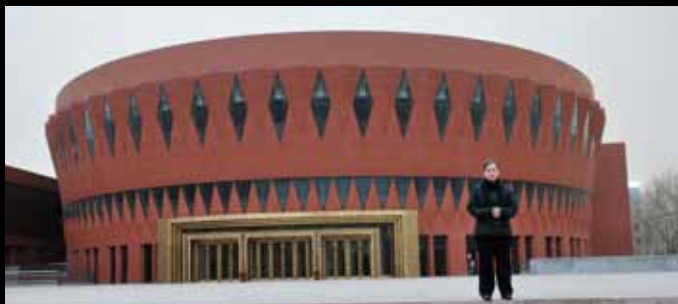
Neues Audimax der Tsinghua University 新清华学堂