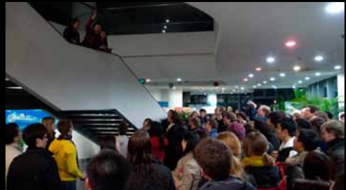
rechts oben: Schumanns „Zigeunerleben“ mit dem Unichor Tongji 右上: 与同济大学合唱团共同演唱舒曼的《茨冈》