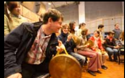
Übungen an fremden Instrumenten 試彈中國傳統樂器