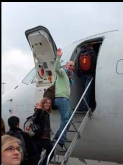
Abflug in Stuttgart 起飛於斯圖加特