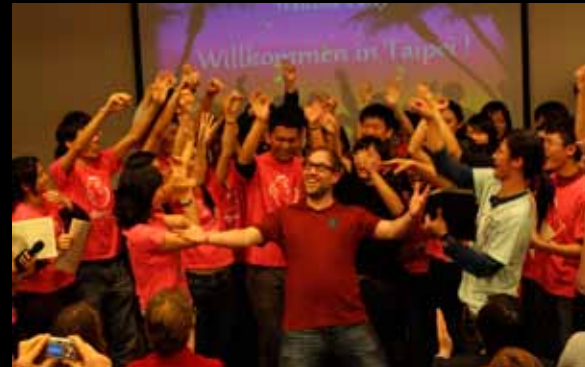
Geburtsstagsständchen auf Chinesisch 用中文小曲《當你生日》為壽星祝壽