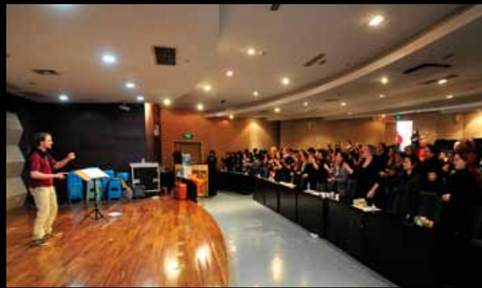
Workshop für Bodypercussion / 人体打击乐的练习