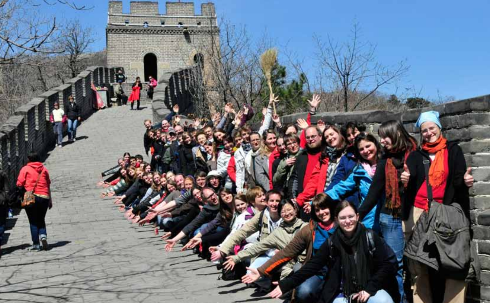
Konzertreise des Akademischen Chors der Universität Stuttgart vom 19.3. – 2.4.2012 nach Taiwan und China 德國斯圖加特大學合唱團2012年台灣和中國大陸巡回演唱會 / 德國斯圖加特大學合唱團2012年臺灣和中國大陸巡迴演唱會