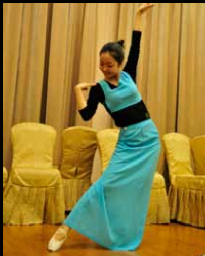
Solotänzerin / 独舞