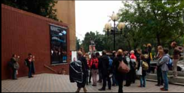
Werbeplakat für das Partnerschaftskonzert am 22.03.2012 in der Grace Baptist Church / 與台大合唱團2012年3月22日 在臺北懷恩堂所舉行的聯合演唱會的巨幅海報