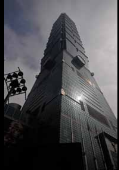
Taipei 101 / 台北101