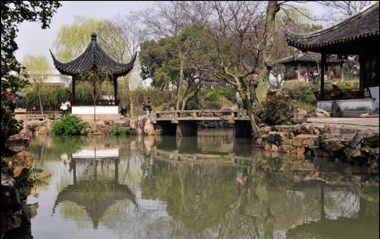
Garten des Bescheidenen Beamten in Suzhou: Die Stadt mit 1000 Gärten / 中国古典园林之城: 苏州之拙政园