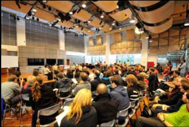
Kammermusiksaal der Taipei National University of the Arts 臺北藝術大學室內樂廳