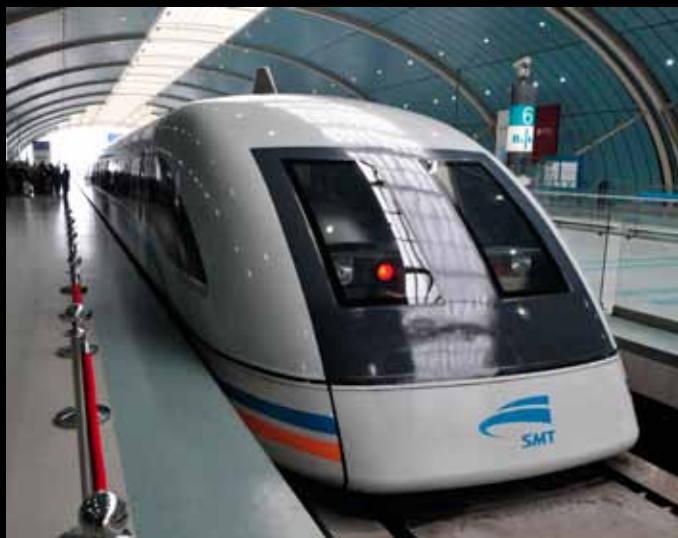
Schnellster Zug der Welt / 世界上最快的列车