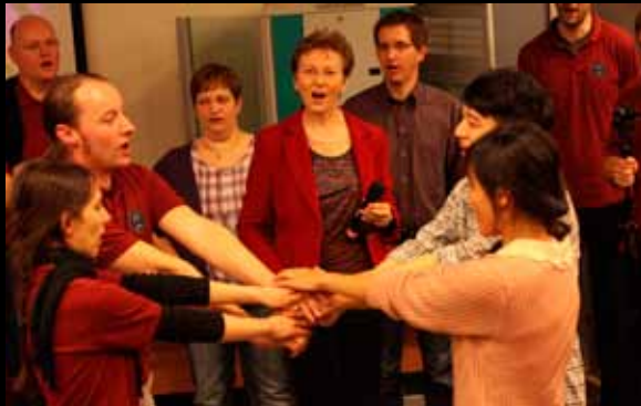
Bunter Abend mit gemeinsamem Singen 聯歡會上兩團高歌齊舞