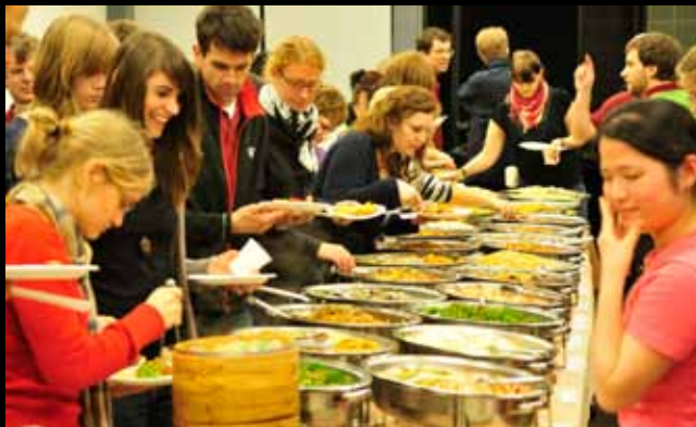
Buffet bei der Welcome Party, gestiftet vom NTU Center for the Arts und NTU Chorus / 由臺大藝文中心與台大合唱團所提供的 豐盛美味、精緻可口的自助餐